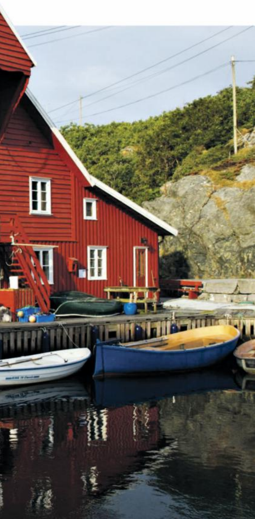
ligger idyllisk til på kaikanten i øygruppen Røvær rett utenfor Haugesund.