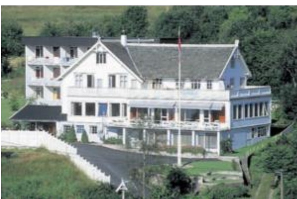
Balestrand vandrerhjem ligger nydelig til, og har fine utsiktsrom til en rimelig pris.