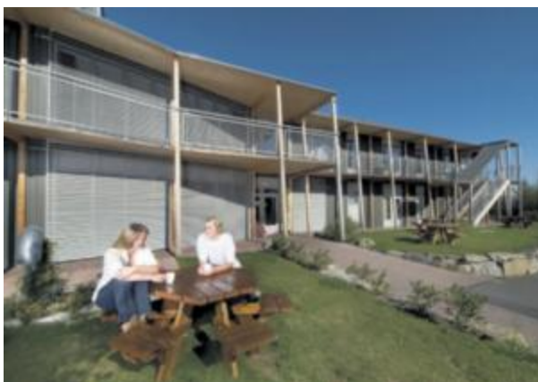
Hamar vandrerhjem er moderne og lekkert.

« Fisker du kongekrabbe i Mehamn kan verten der vise deg hvordan du koker den.