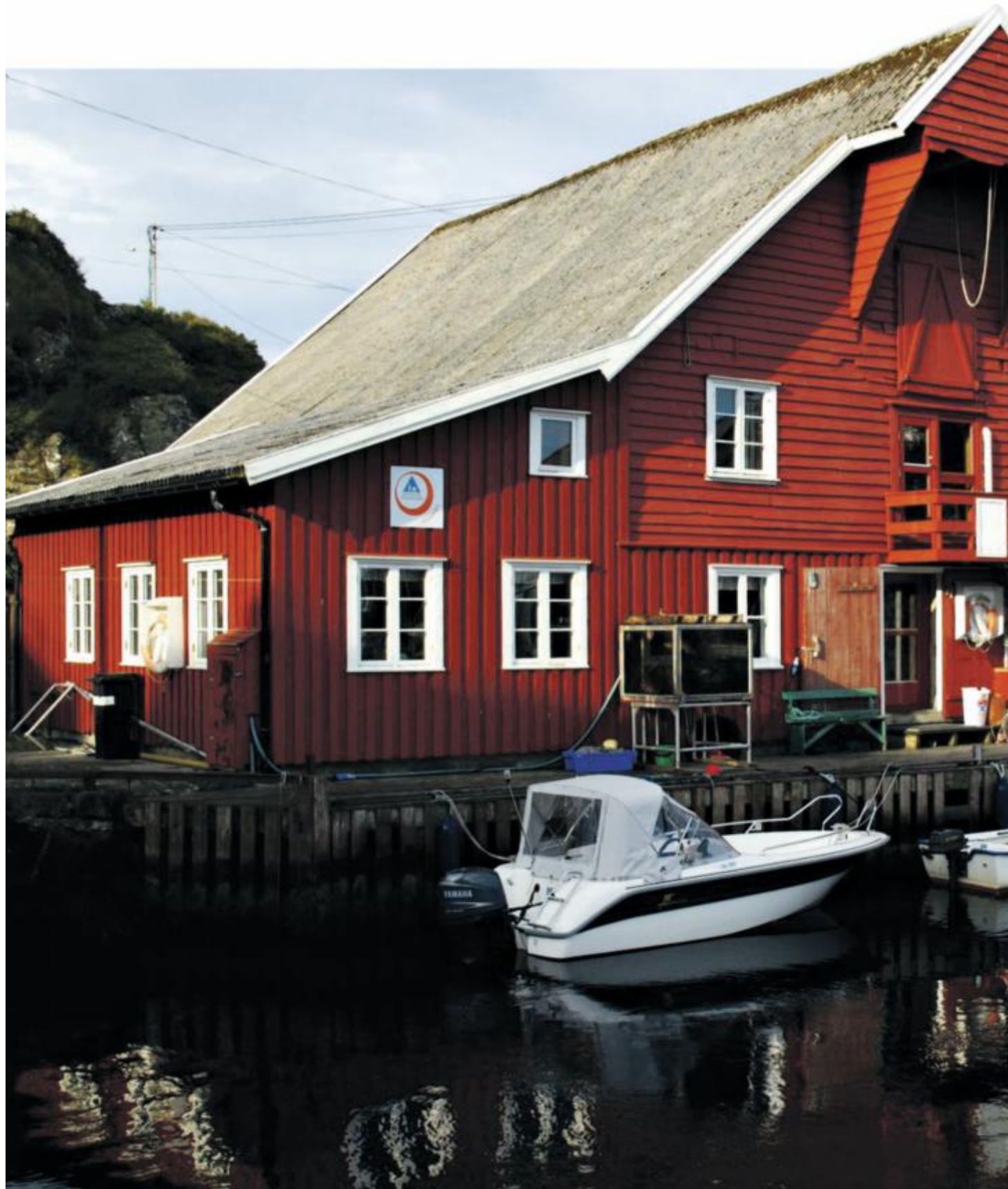
Norske vandrerhjem feirer sine 80 år med fest og åpne dører på alle vandrerhjem landet rundt fredag 2. juni. Koselige Røvær vandrerhjem